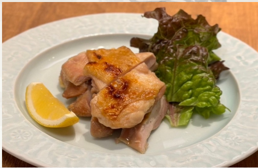
닭소금 구이 또는 폰스구이